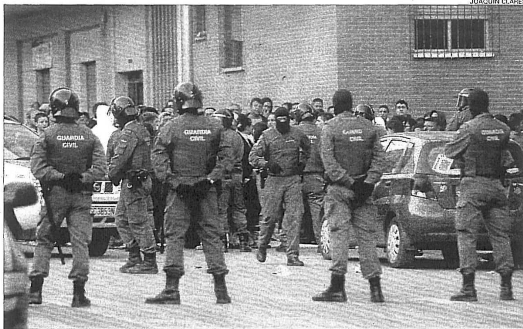
Una redada en el barrio del Espíritu Santo de Murcia, donde sus vecinos conviven con el tráfico de drogas